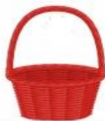
Yarı oynar eklem